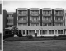
Asklepios Reha-Klinik Bad Schwartau GmbH Am Kurpark 6-12 23611 Bad Schwartau Telefon (0451) 20 04-0