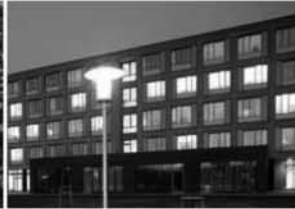
Asklepios Klinik Barmbek Rübenkamp 220 22291 Hamburg Telefon (040) 18 18-82 0