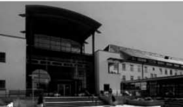
Asklepios Klinik Nord Heidberg Tangstedter Landstr. 400 22417 Hamburg Telefon (040) 18 18-87 0