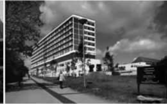
Asklepios Klinik Harburg Eißendorfer Pferdeweg 52 21075 Hamburg Telefon (040) 18 18-86 0