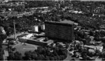
Asklepios Klinik Altona Paul-Ehrlich-Str. 1 22763 Hamburg Telefon (040) 18 18-81 0

Die Asklepios-Kliniken in Hamburg bieten von der medizinischen Grundversorgung vor Ort bis zur überregionalen Spitzenmedizin all die Vorteile, die ein großes Krankenhausnetzwerk auszeichnet. Hier steht kein behandelnder Arzt allein. Gerade wenn es darauf ankommt: Unter den 1.600 Kollegen in Hamburg oder im bundesweiten Netz der rund 100 Asklepios-Einrichtungen gibt es zu so gut wie jedem Spezialgebiet weitere Kapazitäten, die bei Bedarf um Rat gefragt werden können.