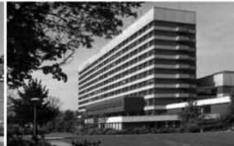
Asklepios Klinik Wandsbek Alphonsstr. 14 22043 Hamburg Telefon (040) 18 18-83 0